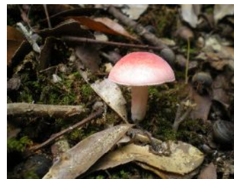
ニオイコベニタケ