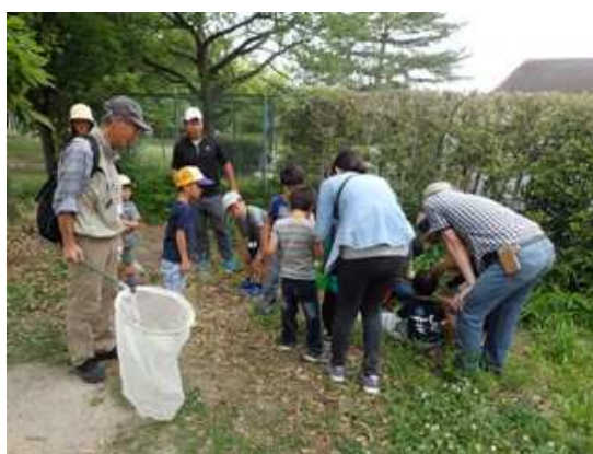
何が採れたのかな？