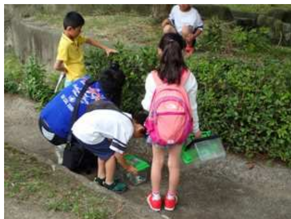
バッタを採りました！