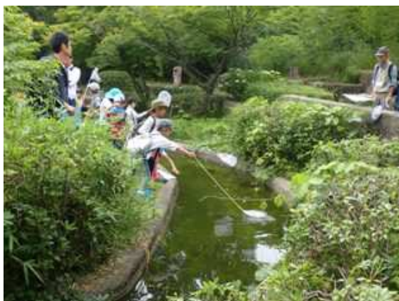
オタマジャクシやヤゴはいるかな？