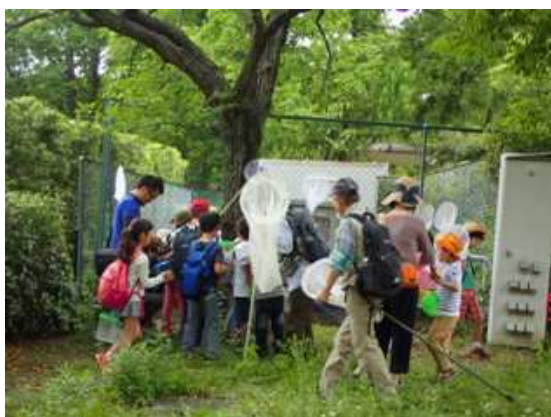
コナラの木でクワガタを探しました。

観察内容／曇天で気温も低めにもかかわらず、多くの方に参加していただいた観察会となりました。公園に入って早々、クワガタ採り名人のスタッフがコナラの木の根元を歩いている大型のコクワガタみを発見。ゴマダラチョウや黄色の綺麗なヨツボシホソバ、シロホシテントウ・オオヒラタシデムシやヤブキリ、ヨコヅナサシガメなど色々な昆虫が見つかりました。子供たちも水のあるところではオタマジャクシやアメンボを採集、アジサイの花に潜るコアアオハナムグリ、草花のあるところではホシミスジやシヨウリョウバッタの幼虫などを採集しました。しかし、子供たちが綺麗なクワガタを採ったと言って持ってきたのが、東南アジアに生息するツヤクワガタの仲間だった事には考えさせられました。近頃では簡単に購入することができるそうです。放虫の可能性が高いので、まとめの中で、「買って来た外国産の昆虫は最後まできちんと飼い、外に逃がしたりしないこと」をお願いしました。