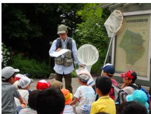
最後に、まとめをしました。