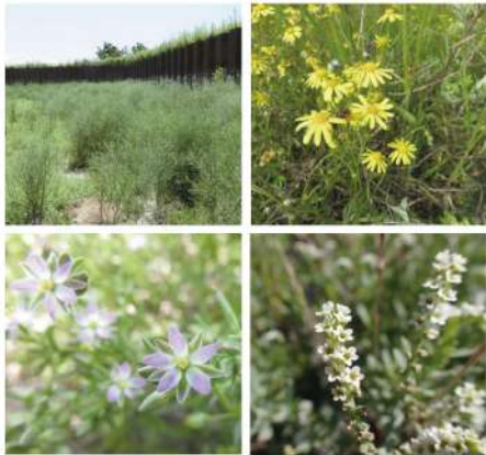
図-4 夢洲の塩性湿地に見られた外来植物たち。 上左：ホウキギク、上右：ナルトサワギク、 下左：ウシオハナツメクサ、下右：アレチムラサキ。