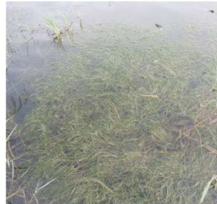
図-6 リュウノヒゲモ。環境省RDBでは絶滅危惧II類。発行後に確認されたため大阪府レッドリストには未掲載。