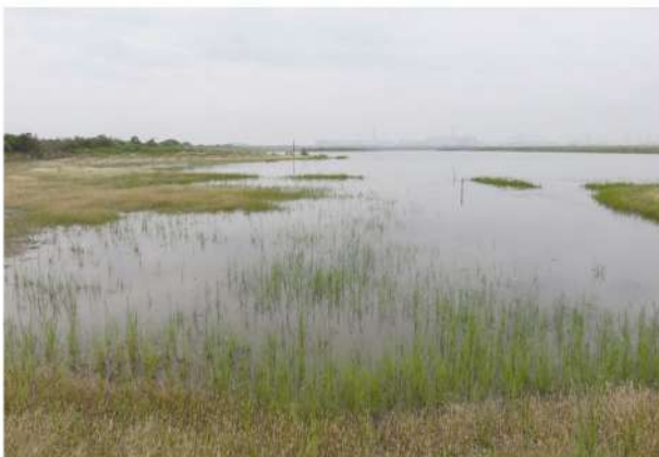
図-1 夢洲工事地区に広がる広大な水域。この水域ではツツイトモ、ホザキノフサモなどの水草が確認されたが、現在は埋め立てが進みほとんど残っていない。