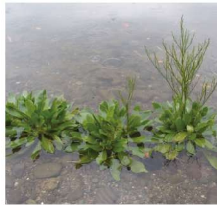
図-3 ハマサジ。大阪府レッドデータリストでは絶滅危惧Ⅰ類。夢洲では1株のみ発見。