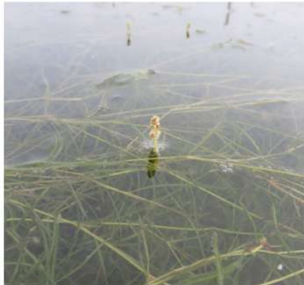
図-5 ツツイトモ。環境省レッドデータブックでは絶滅危惧II類とされる。大阪府レッドリストには掲載が無いが、今後掲載を検討すべき種の一つ。