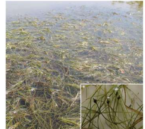
図-7 夢洲で再発見されたカワツルモ。右下はその果実。