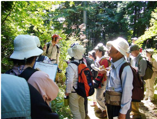
第5期 「金剛山の自然」 (金剛山: 2007年9月)

注) 野外での活動が中心になりますので、軽ハイキングをする程度の体力が必要です。