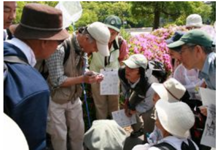
第6期「昆虫①」春に見られる昆虫(服部緑地) (2008年5月)