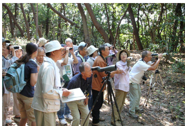
第8期 金剛山の自然 (2010年9月)