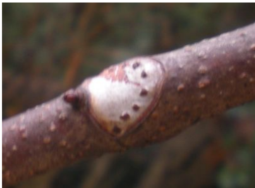
トチノキの葉痕(葉の落ちたあと)