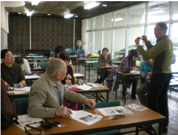
羽のしくみについて学びました