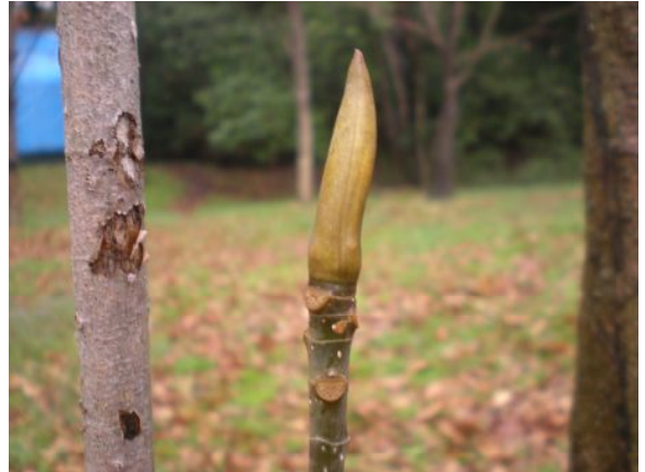
ホオノキの冬芽と葉痕