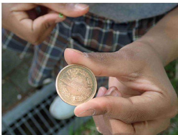
カタバミの葉っぱで10円玉がピカピカに！