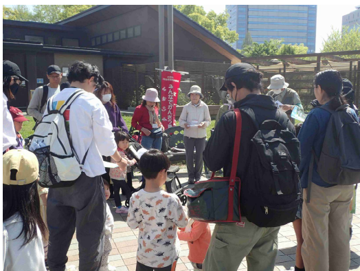
今日はタンポポをさがします

最後に、ピース大阪の「にのいの森」に移動。草花を7種類集めて台紙に貼り付けてもらいました。皆さんそれぞれに思い思いの「私の春の七草」ができました。