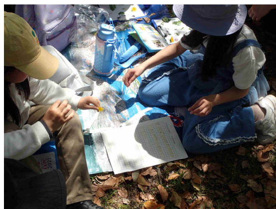
タンポポの花の数調べ、ああ～しんど