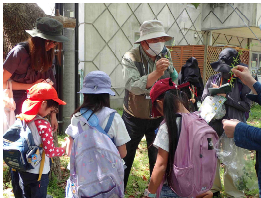
これは、ひつつき虫(ヤエムグラ)です！