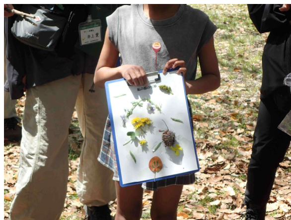
草や花を7つ見つけ「私の春の七草」を作りました