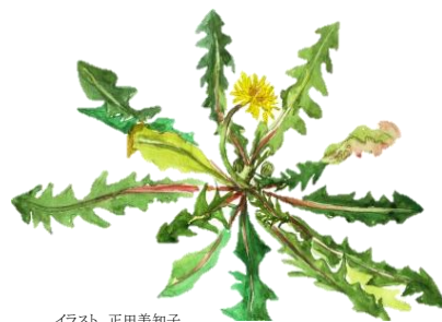
イラスト 正田美知子