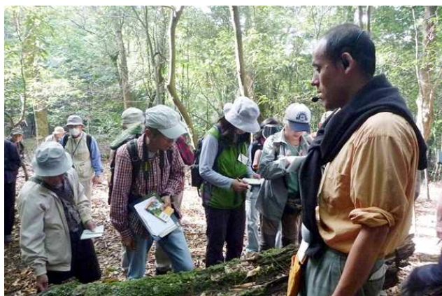
第9期キノコ・菌類